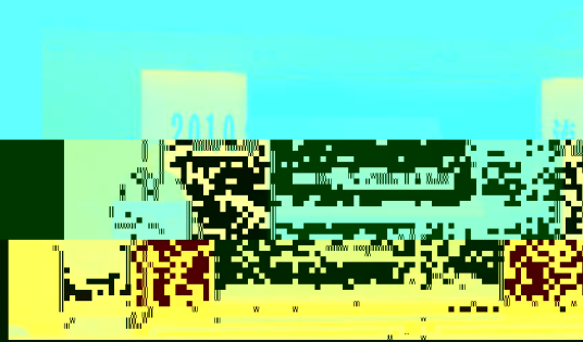
教育学院2010年度学术交流会会场中心

会议由院党委书记、党委书记、副书记主持，各系、中心主任、副主任、支部书记和全体教师参加了会议。会议首先由党委书记致词，他指出，学术交流是教育学院的重要工作之一，也是提高学院学术水平和科研能力的重要途径。他希望全院教师能够积极参与学术交流，为学院的建设和发展做出更大的贡献。